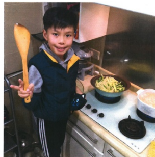
我去年生日時為家人親手做了一頓飯呢!

這樣,獅子山下的每一個香港家庭,都能帶着愛回家,與家人一起大快朵頤,安心又放心地享受健康又美味的晚餐了!